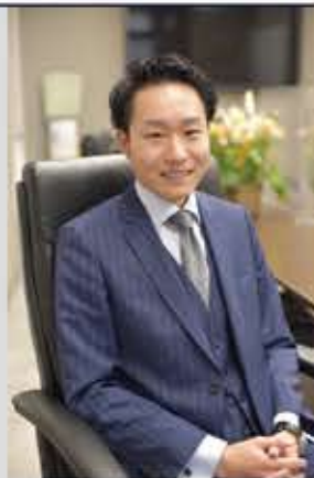
大石会計事務所 大家財務コンサルタント & 大家

実家の賃貸経営(アパート5棟/全86室)が危機的状況であることが発覚し、立て直すために経営を引き継ぐ。節税、法人化、管理会社の変更などにより黒字化に成功。資産税専門の税理士法人に勤務後、2011年に独立開業。税理士と大家の両方の視点から賃貸経営に困っている大家さんのサポートに取り組む。