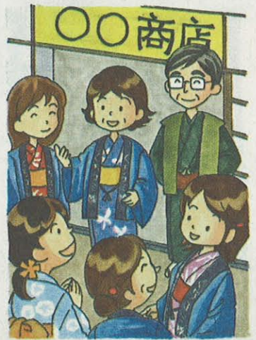
イラスト・とよみ ますみ

「買い物物なら、八王子より、立川よねえ」。八王子市民からも、そんな言葉を耳にすることが多い。私自身も、専門的には敷居の高さを感じてはいた。だが、のれんをくぐる、温かい出迎えがあり、店員からは豊富な知識が飛び出してくることを知り、専門店で購入する機会も増えた。売り出しの声とクリスマスイルミネーションに彩られた師走の商店街。歩きながら、くちコミ隊の活動を起爆剤に、多くの人たちでにぎわえばと願う。(井上妃)(おわり)